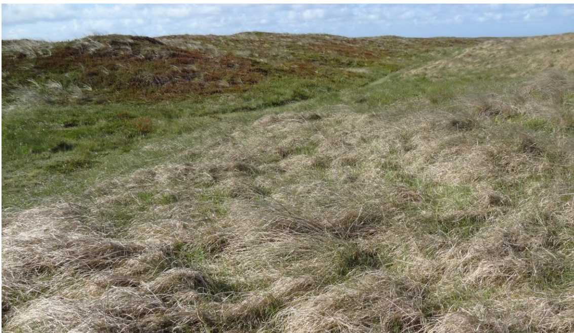
Klithede ved Lild Strand. Klithede er én af de prioriterede naturtyper i Natura 2000-området.

Kommunerne indgår i dialog med interesseorganisationer, som har en særlig viden om arter og naturtyper fra udpegningsgrundlaget eller gør en særlig indsats for disse i området.