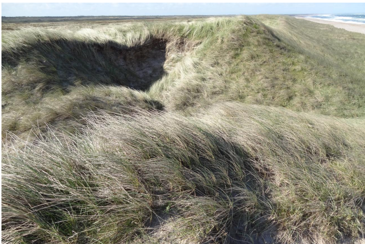
Kystlandskab ved Lild Strand. Området består af Lild Strandkær, som er en lobelie sø, to brunvandede søer og en række klitnaturtyper.

I handleplanen anvendes en række Natura 2000-begreber m.m., som er defineret nærmere i bilag 5.